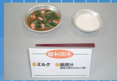
1945年(昭和20) ミルク(脱脂粉乳)・味噌汁(鮭缶詰と輸入ほうれん草)