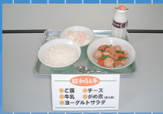
1979年(昭和54) ご飯・牛乳・チーズ・がめ煮(郷土料理)・ヨーグルト・サラダ