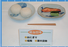
1889年(明治22) おにぎり・塩鮭・菜の漬け物

山形県鶴岡町の私立忠愛小学校で、貧困児童を対象とした学校給食を実施。我が国の 学校給食の起源 となる。