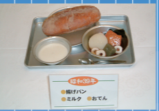
1964年(昭和39) 揚げパン・ミルク・おでん

10月 「学校指導要領」が改訂され、学校給食が学校行事等の領域に位置づけられる。