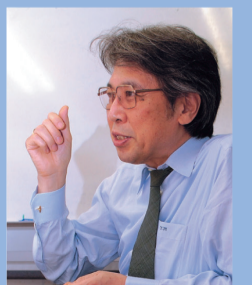
村上 陽一郎 科学史 科学哲学