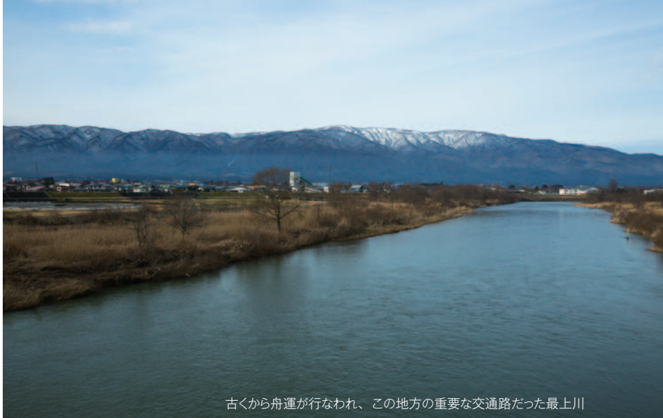
古くから舟運が行なわれ、この地方の重要な交通路だった最上川