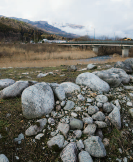
野川の洪水から長井を守った「平山の締切堤防」の遺構。総石積みで、長さは450mにも及ぶ