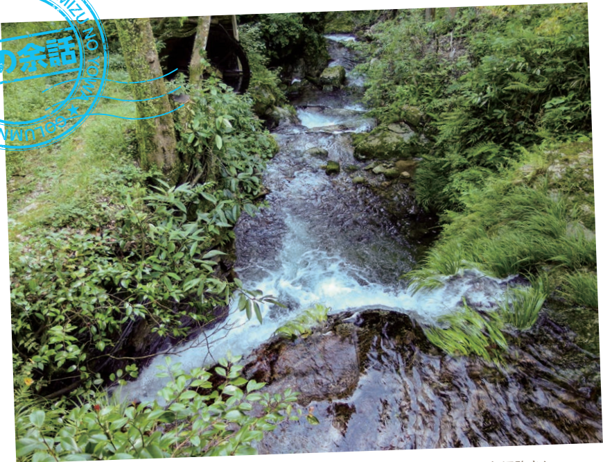
落差や淀み、激しい流れが入り混じる川。まるで人生そのものようだ