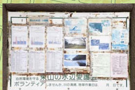
和泉川の水位・水質・水温などのデータ類が貼り出された掲示板