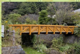
木造船の龍骨をイメージした「東山ふれあい橋」