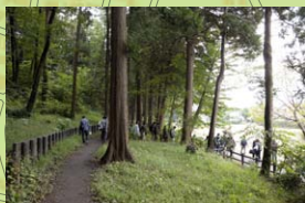
東山ふれあい樹林の散策路