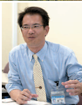
横浜市水道局 総務部総務課