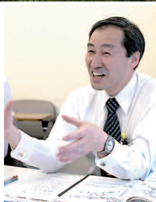
横浜市水道局 建設部計画課