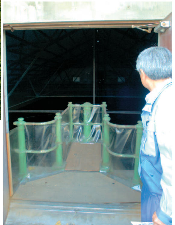
1901年（明治34）に建設された配水池。東名高速横浜インターのすぐ近くにある川井浄水場で100年の時を刻み、現役選手としていまだ健在だ。扉を開けてもらえると、モダンな鉄柵が明治のモダニズムを感じさせる。左：横浜桜木町駅近くにあるモニュメント。日本の近代水道は、イギリス人ヘンリー・スペンサー・パーマーが指導して、1887年（明治20）に敷設したことに始まるが、これは当時の水道管。現存する最古のものだ。