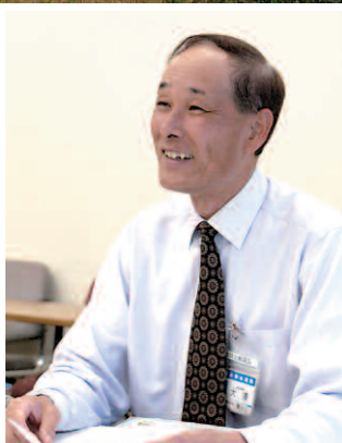
横浜市水道局 経営企画部経営企画課