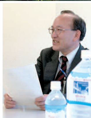
横浜市水道局 営業部「はまっ子どうし」担当