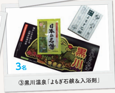
③黒川温泉「よもぎ石鹸&入浴剤」