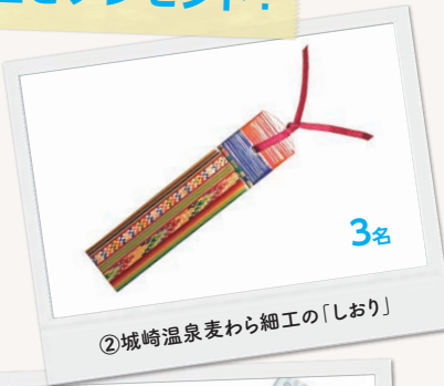
②城崎温泉麦わら細工の「しおり」

今号の取材で巡った温泉地のお土産を抽選で9名の読者に差し上げます。右の「72号アンケート」にWebから回答のうえ、ご応募ください。なお、お土産への応募期限は2022年12月31日(土)とさせていただきます。