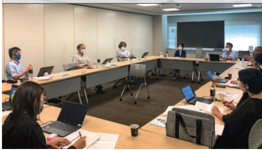
ミツカン東京ヘッドオフィスで実施したアドバイザー会議

2022年9月にアドバイザー会議を実施しました。3名のアドバイザーに本年度前半の活動について報告。また、2023年度の活動計画案をお伝えしたうえで、活発な意見交換を行ないました。