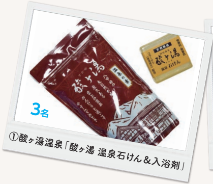
①酸ヶ湯温泉「酸ヶ湯 温泉石けん&入浴剤」