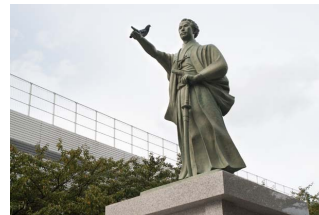
墨田区吾妻橋1-23-20 墨田区役所前うい広場緑地内

墨田区役所の脇に、右手を前に突き出した海舟の像があります。日展作家木内禮智の手になる銅像で、像高2.5m、台座も入れると5.5mにもなります。この海舟は壮年期、新しい日本を思い描き、アメリカを目指そうとする瞬間を捉えたものです。平成15年に建立されました。区役所1階アトリウムには、禮智の作品や勝海舟コーナーもあります。