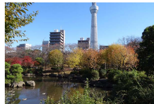
墨田区向島1、2、5

隅田川沿いにある公園で、墨田区側の左岸は向島1、2、5丁目の面積約8万平方メートルの広さを誇ります。春には屈指の桜の名所となります。公園内の庭園は水戸徳川邸内の池等、遺構を利用して造られています。関東大震災後で屋敷が全壊するまで代々ここに住んでいたと伝えられますが、その後隅田公園の区域に取り込まれ、日本庭園へ姿を変えました。春には1kmにおよぶ桜並木が見事な屈指の桜の名所となり、夏には隅田川花火大会が行われます。1931年(昭和6)に開園。