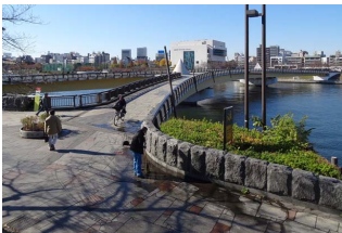
墨田区向島2

墨田区と台東区の共同事業として、1985年(昭和60)に完成した隅田川唯一の歩行者専用橋。兩岸の隅田公園を結ぶ園路の役割を果たします。周囲の景観と調和するように配慮され、河川の橋としてはめずらしいX状の外観を持ちます。カミソリ提防のころは水辺に降りられませんでした。親水性に配慮した整備が進み、今では入れるようになりました。