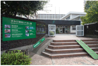
墨田区文花1-32-9 http://fr-kan.org/ 10:00～17:00(月、水、12/29～1/3は休館) 無料

2001年(平成13)、墨田区環境学習の拠点として、小学校の廃校を利用して開館いたしました。NPO法人雨水市民の会が墨田区から管理委託を受けて運営しています。「雨水資料館」「環境工作室」「交流スペース」「時間の部屋・起源の部屋・循環の部屋」から構成され、ほとんどが廃材・リサイクル品を利用して空間が構成されたユニークな施設となっています。また、様々な雨水タンクの展示や雨水資料室、雨の絵本広場等の見学ができます。当該施設のトイレは、雨水利用をしています。