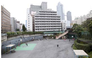
明石町 10-2 7:00～20:30 無料

入船橋付近で築地川は南に方向を変え、その曲がっていた部分の川床を活用したのが築地川公園の多目的広場です。上から眺めれば直角に近い角度で曲がっていた運河の痕跡が、広場に立ってみると川幅の広さや深さが実感できます。この広場から南側は暗渠（あんきょ）になり、蓋の上は緑地が続く公園になっています。暗渠の中は、晴海と連結する予定だった首都高10号線建設計画のトンネルの名残で、現在はフェンスが張られ、中央区が土木資材の倉庫などに使っています。