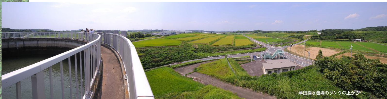
半田揚水機場のタンクの上から