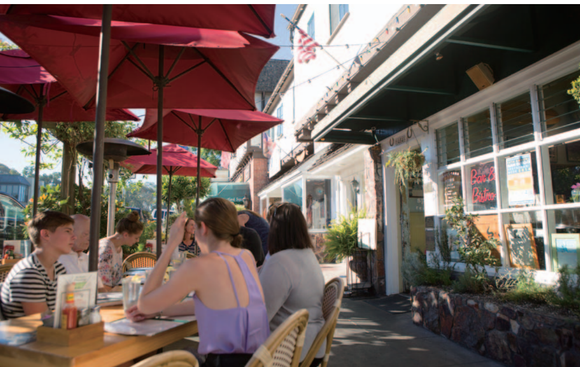
オープンカフェでつるぐ人々(アメリカ・カリフォルニア州サンディエゴ)

に必ず青が入っています。また、国 によってタブーとされる色はさまざ まですが、唯一、青だけはタブー色 になりにくいという研究もあります。 青から連想されるのは、水の色、 海や空の色です。そういった生命の