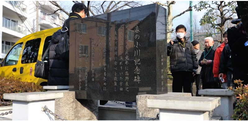
春の小川の歌碑（上）と、「合流」と書かれたマンホール（東京都渋谷区松漣にて）。