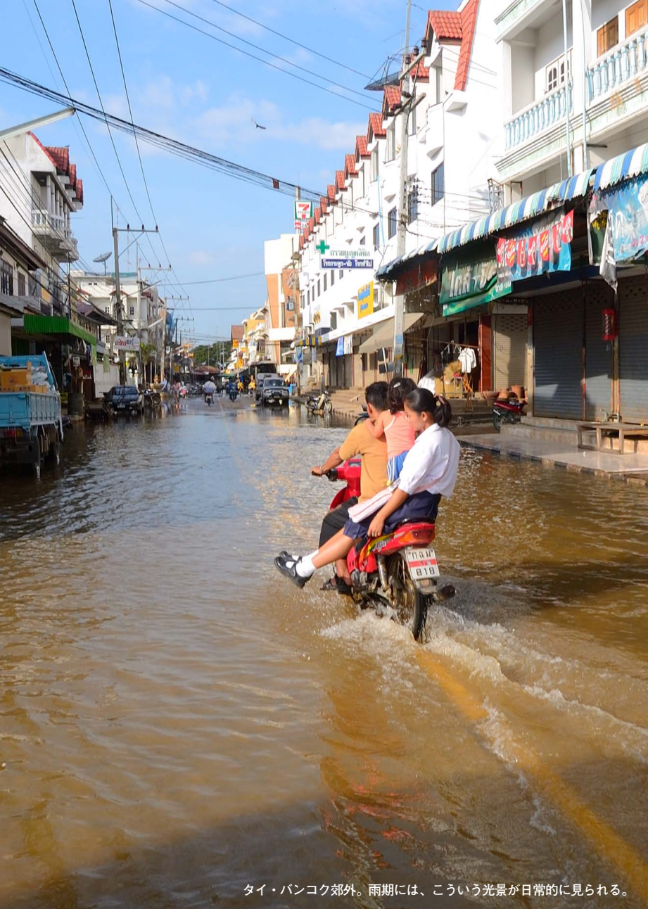
タイ・バンコク郊外。雨期には、こういう光景が日常的に見られる。

に戻せるような仕組みにはなっていません。蓋の下には汚水が流れているわけですから、単に蓋を外したらとんでもないことになるし、道路の下に下水道を全部敷き直すとなると大変なお金がかかります。蓋を開けたら済むことではなく、全体の仕組みを変える必要が生じます。水の構造物というのは、線のなんですね。箱モノは点なのでそれだけ建て替えれば済むんですが、線的な構造物は1カ所だけ変えろということができない。