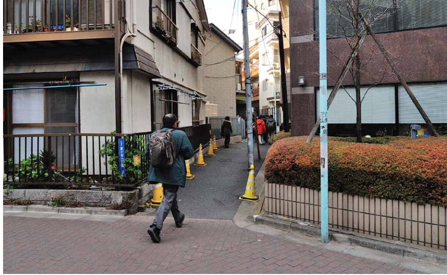
右ページ：渋谷駅南東側を流れる、渋谷川。河川の水幹線を通して、この場所から下水幹線に運ばれ、下流にいくと、水量維持のために処理水が入られる箇所がある。 左ページ：細い路地は、暗渠化された川の跡。川に面していた跡やマンホールなどから、もとの流れが推測できる。