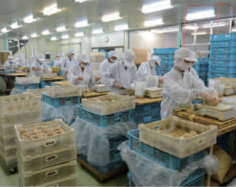
きのこの里の生産風景。衛生管理を徹底させた作業場。電気分解で酸性水（電解還元水）をつくり、殺菌・消毒に使っているという。