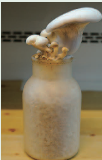
右・下：きのこは菌床で育てられ、その掻き出し屑は堆肥にしてアスパラガス栽培の有機肥料として役立つ。無駄のない循環型の農業を後押ししている。