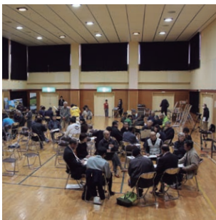
農家同士でグループワークなど研修会も実施