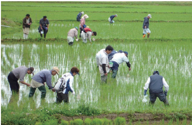
農家による「生きもの調査研修会」