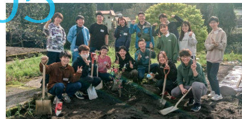
提供:坂本貴啓さん