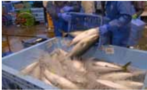
ブリ漁期も終わりを向かえようとする2月に、氷見漁協を見学させていただいた。獲物を載せた船が続々と帰港し、手際よく、競りにかけられていく。