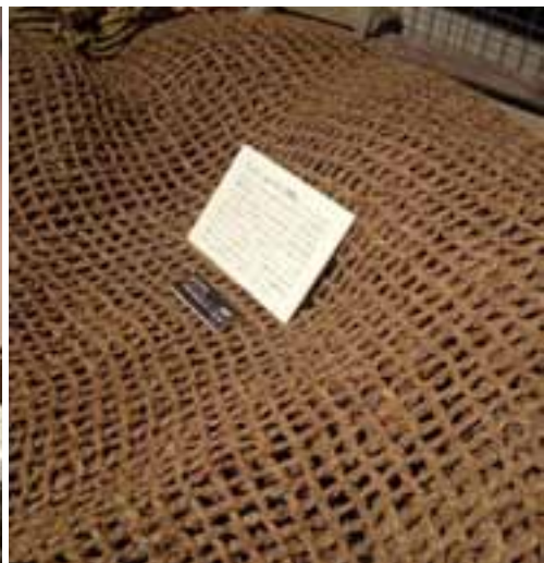
26ページ：塩ブリを入れて運んだブリ籠。 27ページ：右から織り網、ドブネ、大敷網の敷設模型。織り網は、魚が入る身網の部分に用いられ、指が入るぐらいの細かい目で編まれた。ドブネは、胴部分の断面が四角いことから「箱船」とも呼ばれ、大きなものは「ドブネ1ばい、家1軒」といわれるほど高価なものであった。模型は改良された「越中式締落とし網」のもの。

ごとに滑車で上げて乾してました。そのまま置いておくと、蒸れて繊維がもろくなるのです。