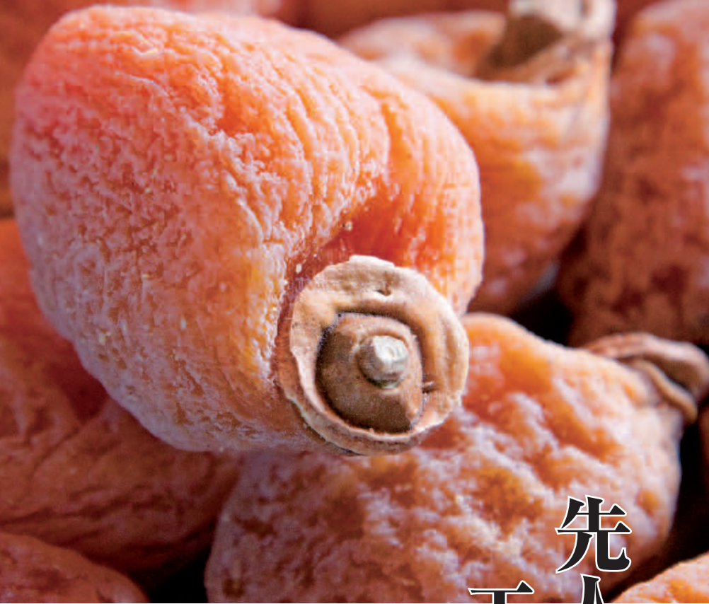
表面に付いている粉は、糖分が水分とともににじみ出たブドウ糖の結晶。この粉が均一に薄く覆っているものが極上品とされる