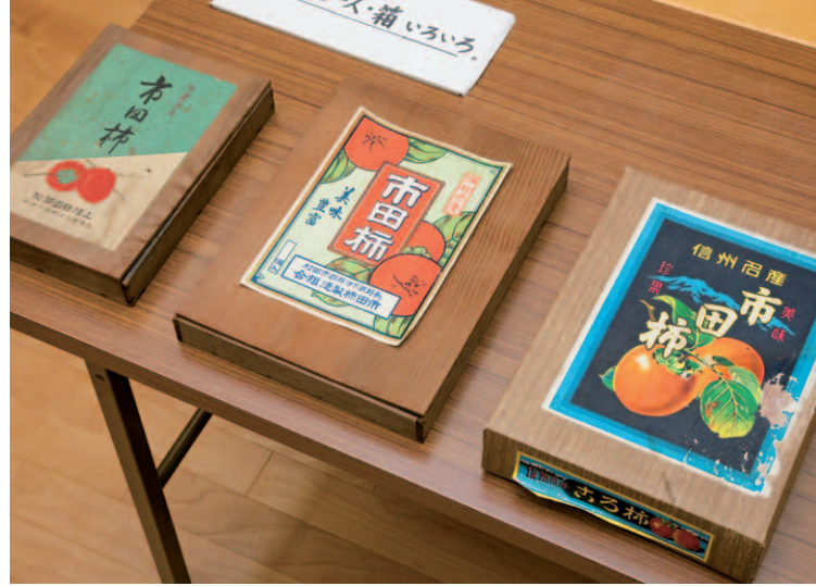
高森町歴史民俗資料館が所蔵する初期の化粧箱。左端の秋田杉の化粧箱には、蓋に「上沼柿園」と記されている