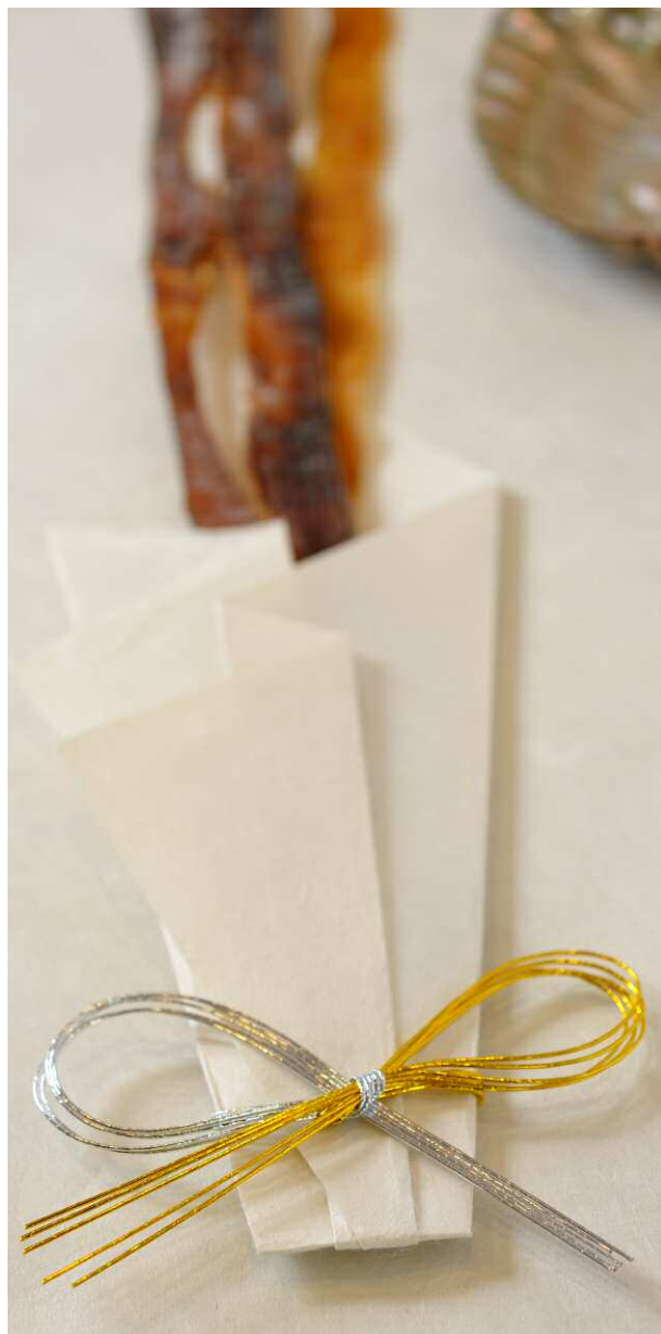
上：新茶の芽を折り出した、新茶包み。かつては、貴重な仙薬だったお茶を贈ることは、最高のもてなしだった。江戸時代には、お茶を包むための折形がいくつか考案されている。 左：結納に使う、本物の〈のし鮑（あわび）〉の折形。お茶や粉は散らないように全部を覆い隠すが、不都合がないもの場合は、中身が表われるように〈包む〉。 下：武家の最上位の手紙を再現した縦文（たてぶみ）。情報である手紙は、天地を捻って紙縫りで結び、簡単に開封できなくした。〆などの上書きをする。